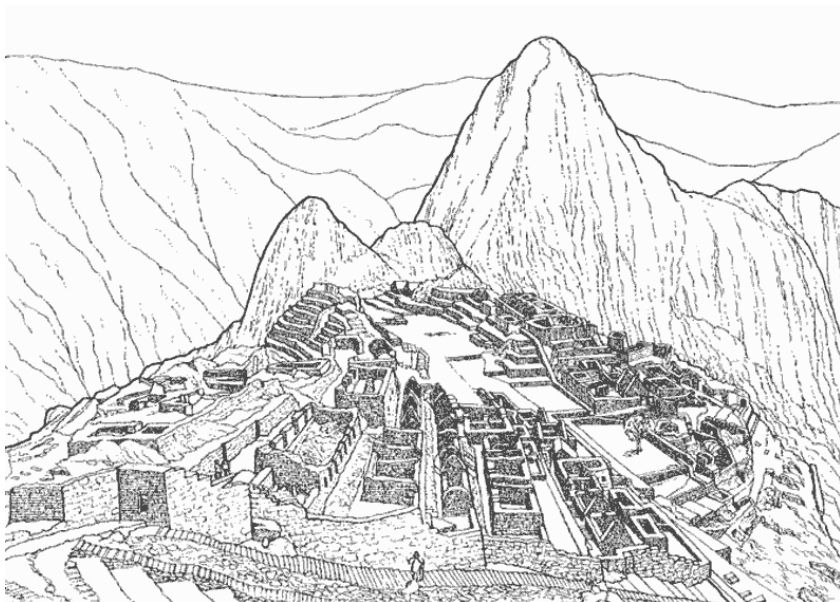
Machu Picchu, ícono de la cultura inca en Cuzco, actual Perú